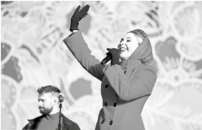
Горячее выступление Пелагеи

Руководитель СИБУРа подтвердил слова губернатора Тюменской области, что грандиозные совместные