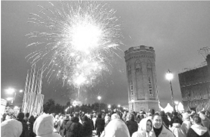
Праздничный салют в честь Дня нефтехимика