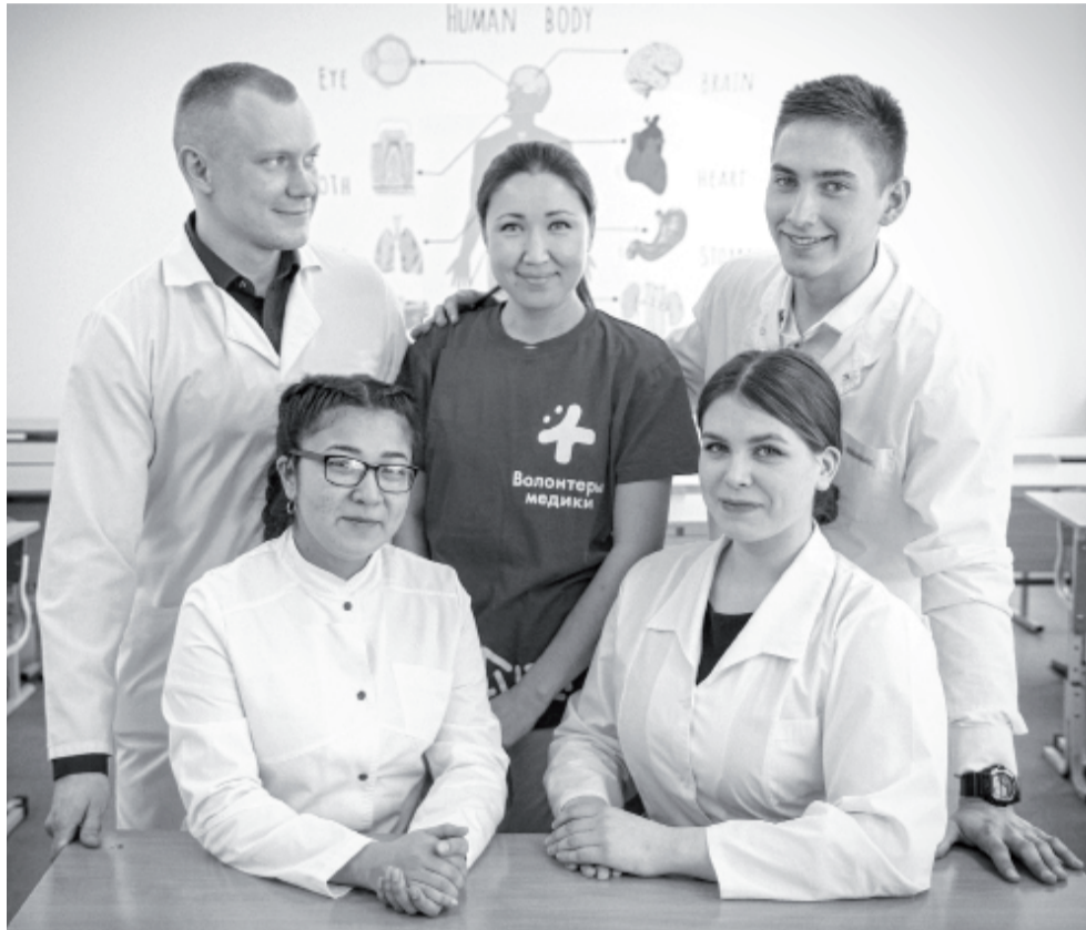
Профессию выбрали по зову души и готовы следовать заветам Гиппократ – студенты-медики поделились впечатлениями о работе в пандемию. // Фото Василия БАРАНОВА.

– Это уникальный опыт, – считает студент. – Не было страха заразиться, больше давили груз ответственности и желание помочь в сло-