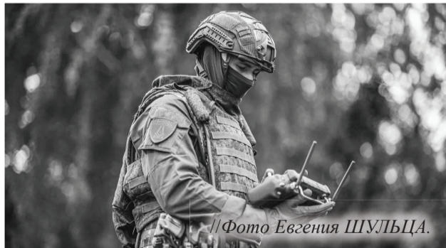
//Фото Евгения ШУЛЬЦА.

Пресс-служба губернатора Тюменской области.