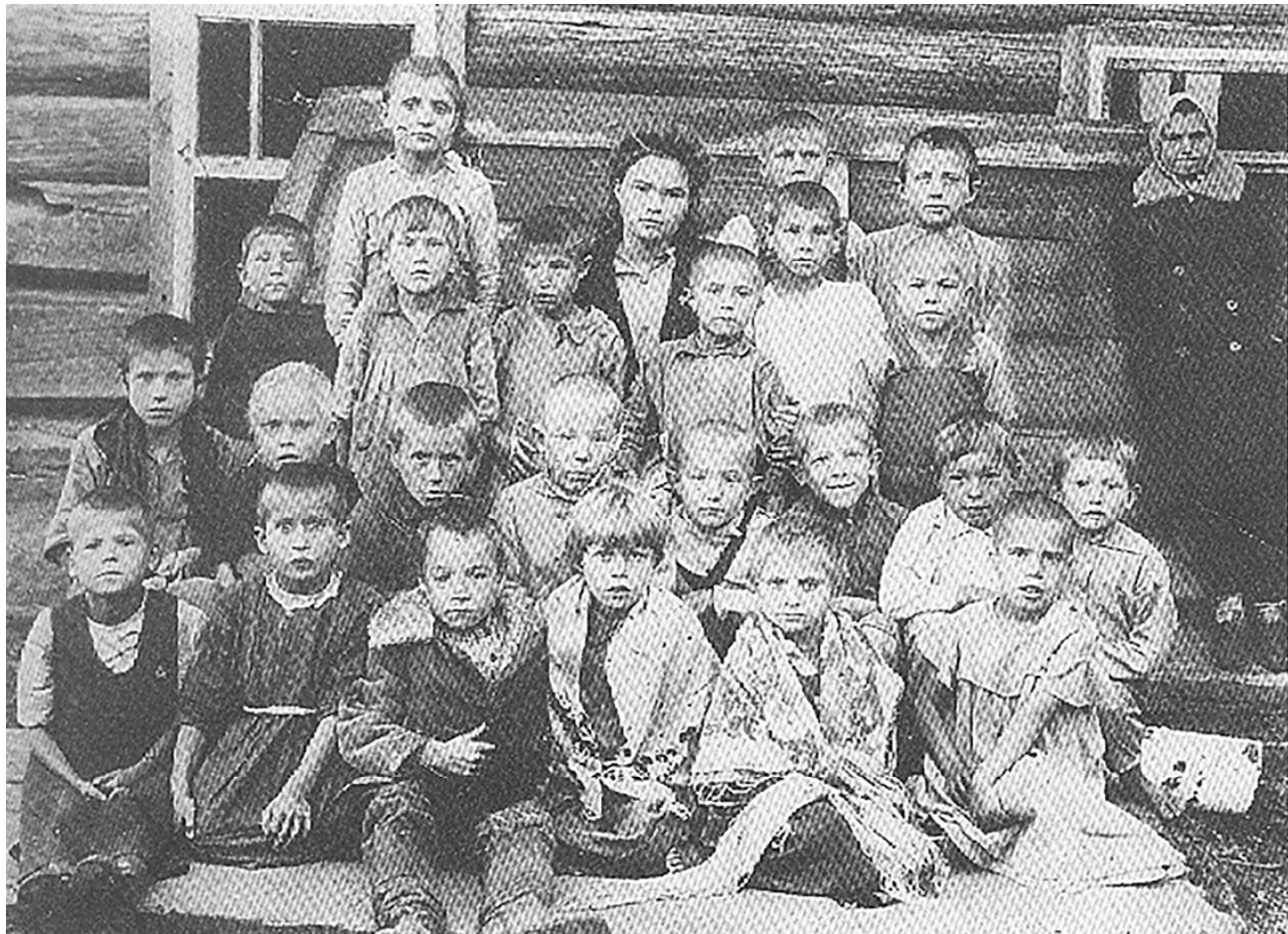
Детско-ясельная группа Носыревского детского дома. 1947г.