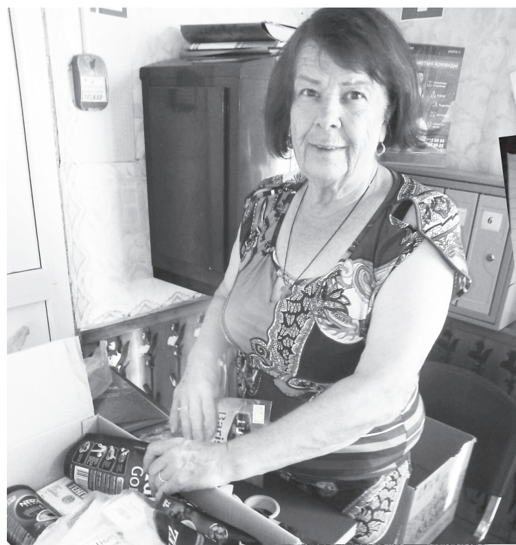
Через несколько минут посылка отправится к адресатам