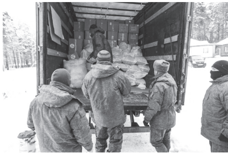
Помощь, оказанная тюменцами, очень поможет

Напомним, гуманитарный груз был сформирован за счёт регио-