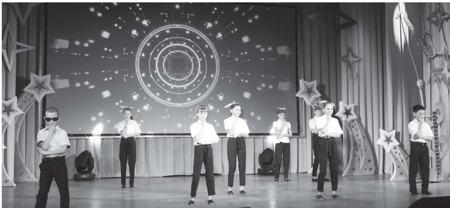
Хореографический номер представили ребята из школы-интерната – группа «Непоседы»