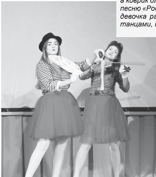
Фестиваль – возможность проявить свои таланты