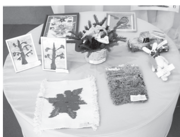
На выставке в фойе РДК