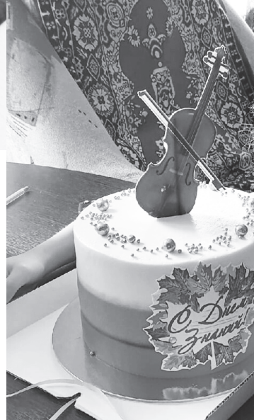
Торт – ответный привет от бойцов