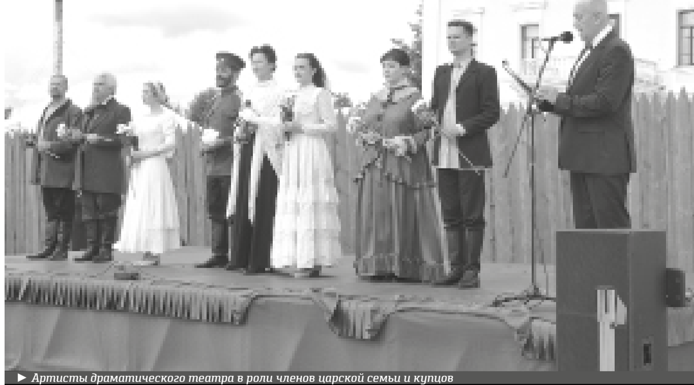
► Артисты драматического театра в роли членов царской семьи и купцов

тельности императорская семья служила живым примером и образцом. Начало XX века стало тяжёлым испытанием для России – Первая мировая война, эпидемия туберкулёза. Члены царской семьи передавали средства в помощь соотечественникам. Императрица Александра Фёдоровна развернула госпиталь в помещениях Зимнего дворца, где сама ухаживала за солдатами, в чём ей помогали две её дочери – Ольга и Татьяна. В помощь больным туберкулёзом они органи-