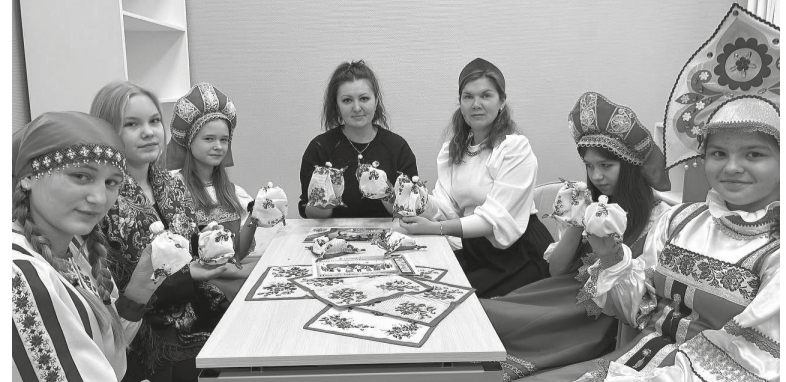
Молодые специалисты уверенно продолжают традиции старших коллег, внося в любимое дело свежие идеи и неугасающую энергию

Наверное, самые яркие воспоминания связаны с масштабными праздниками? Безусловно. Каждый год для нас — это череда событий. Но особенно трепетно мы готовимся к юбилейным датам района, к Новому году, к Дню Победы. 9 Мая для нас — священная дата. В эти дни мы ста-