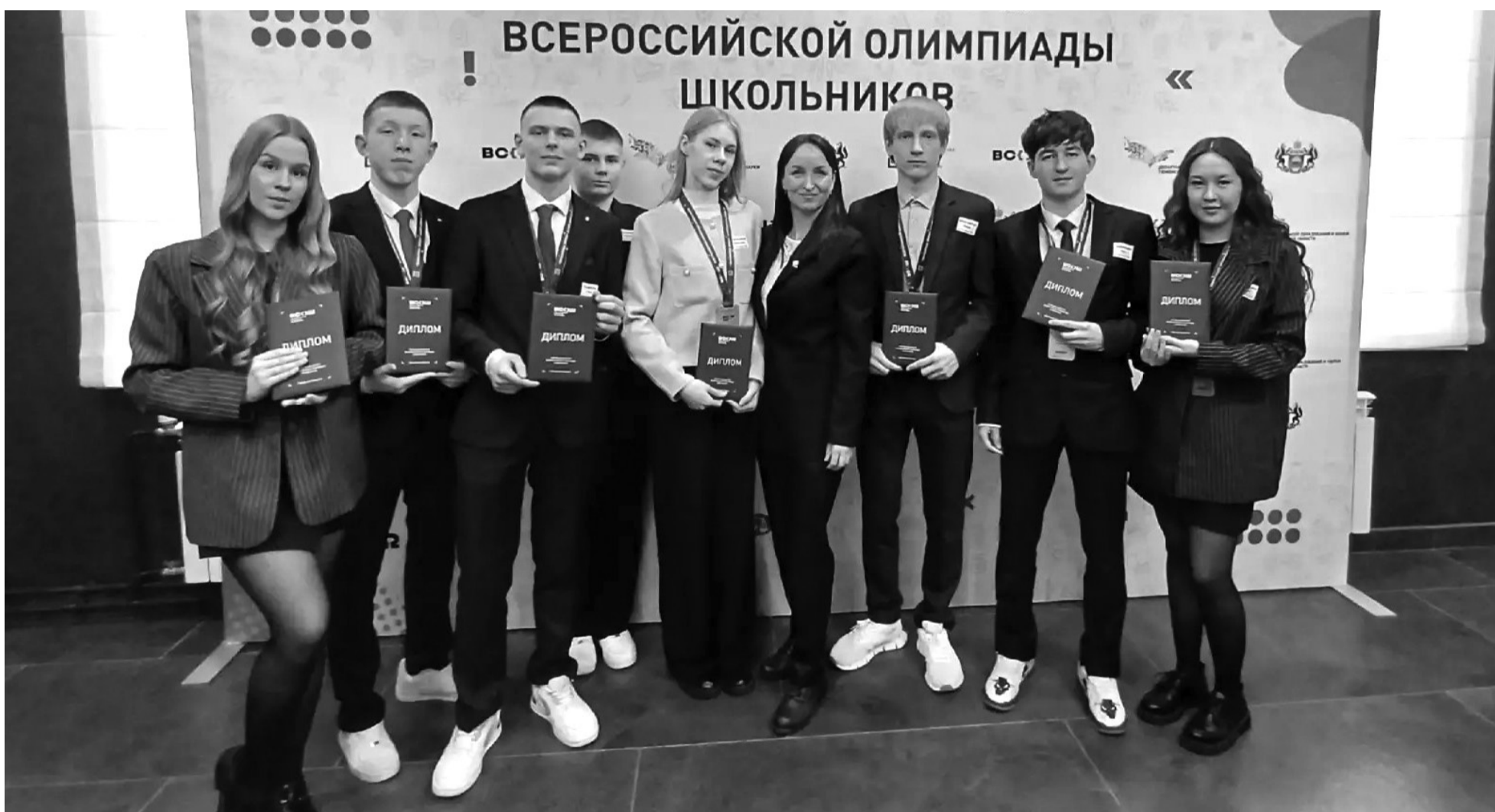
© Наши ребята вновь доказали: талант, труд и упорство не знают границ./ ФОТО: АРХИВ

Событие. Школьники Сорокинского округа в числе лучших