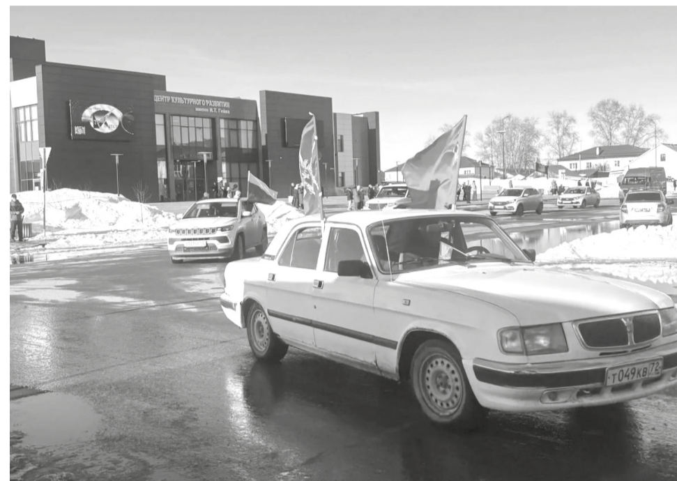
На снимках: фрагменты мероприятий, посвящённых Дню воссоединения Крыма с Россией

ликой державы. Победа будет за нами! И когда мы едины, мы непобедимы. Сегодня мы вновь проводим автопробег в поддержку великого воссоединения Крыма и Севастополя с Россией.