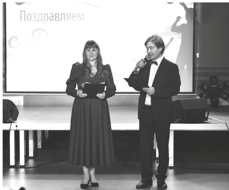
Ведущие Сорокинского РДК — это не просто дикторы за микрофоном, а настоящие проводники в мир праздника.

Секрет прост и сложен одновременно: здесь каждый сотрудник осознает свою роль в общем деле. У нас нет людей, которые работают «от звонка до звонка». Если идет подготовка к большому концерту, забываешь о должностных инструкциях. Всегда готовы прийти на выручку: помочь с оформлением зала, перенести декорации, подсказать свежую идею. Главная задача, которая нас объединяет, — дарить радость зрителю, развивать культурную жизнь района, бережно сохранять традиции и при этом смело привносить новое.