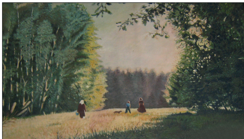
• Картина П. Роляка «Летний полдень». 1990 г.

При подготовке статьи использованы материалы, предоставленные музеем Новопетровской школы.