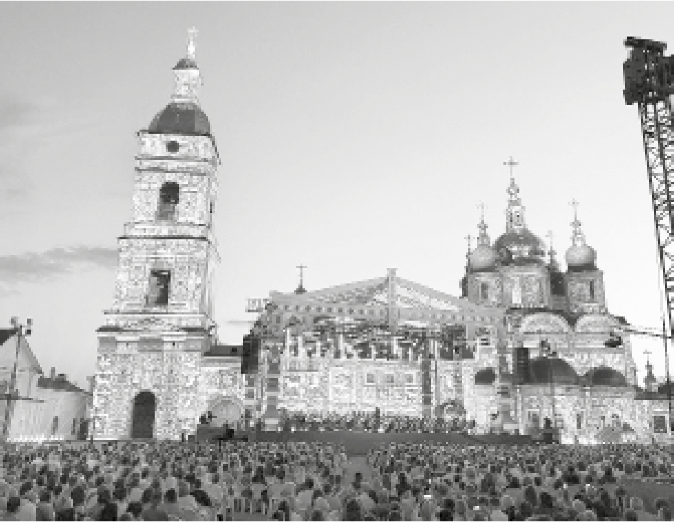
Лето в кремле – 2024