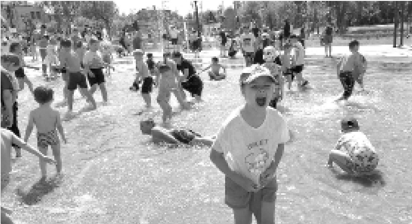
Центром притяжения стал фонтан в Александровском саду

Центром веселья, игр и подарков для юных жителей стали Базарная площадь и Александровский сад. Праздник собрал сотни семей с детьми всех возрастов. Для юных тоболяков организаторы подготовили насыщенную программу, наполненную развлечениями на любой вкус. Работали разнообразные тематические площадки. А начался праздник с шествия «Движения первых». Стройными рядами ребята прошли от Базарной площади по улице Мира до Плацпарадной площади. Участники «Движения первых» подключились к общему ритму праздника – и не как гости, а как организаторы разных игр. К примеру, можно было слепить разные фигурки из послушного пластилина или раскрасить брелок в форме кроссовки. А можно было попробовать себя в роли солиста и исполнить любимую песню. Итак, мы в самом эпицентре активности – в Александровском саду. Здесь при-