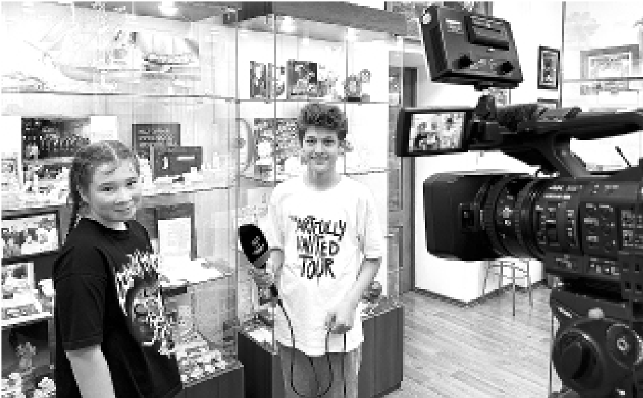
Лагерь «Телелето» в прошлом году