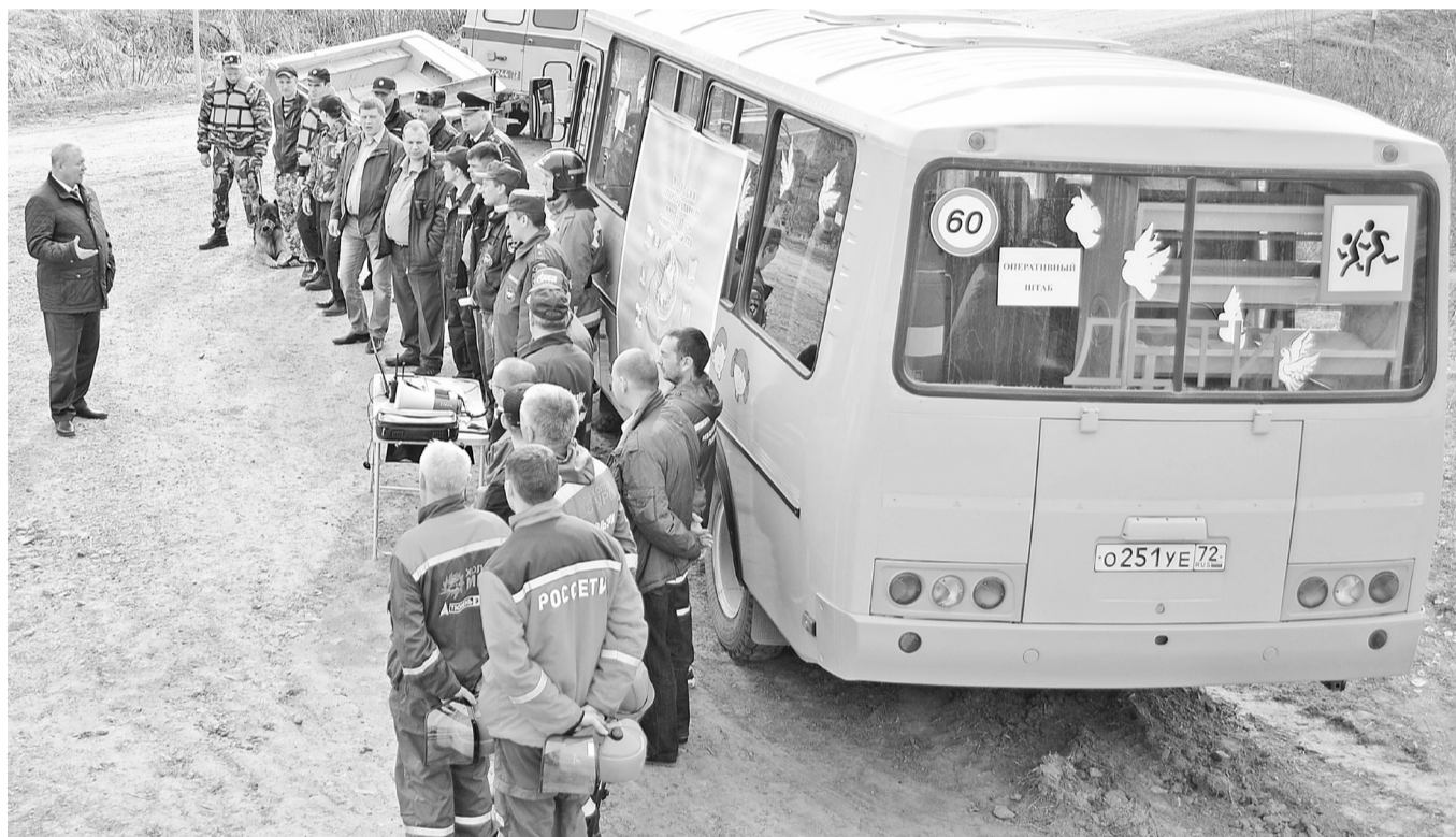
Все службы построены для подведения итогов учений.