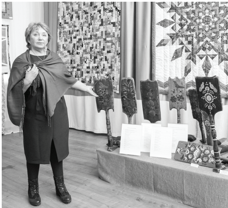
Ввиду ограничений, связанных с распространением коронавирусной инфекции, посетить выставки можно только по предварительной записи по телефону 5-15-22.

– Это удивительный мастер, участник международных конкурсов. К ремеслу она пришла уже в зрелом возрасте, в поисках знаний и опыта добралась даже до Италии, где училась технике итальянской глазури. Специально для выставки в Ишиме Светлана Владиславовна предоставила две серии работ, посвященных сказке «Конек-Горбунук»: панно из шамотной глины на деревянных каркасах, а также квасник (кувшин для напитков) и подсвечники, – рассказала специалист