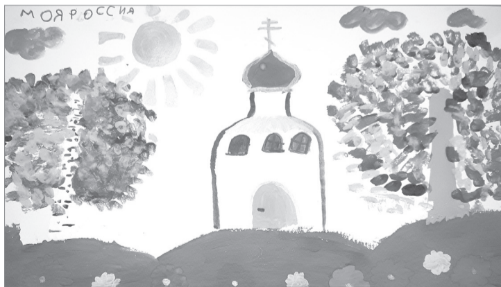
Настя Завьялова, 6 лет