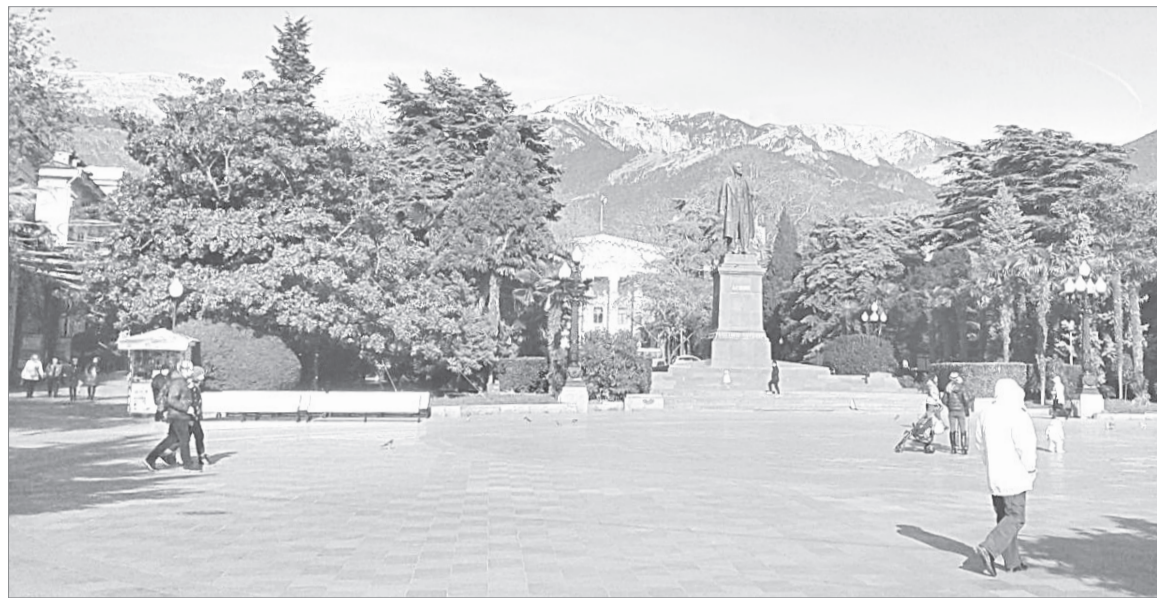
На набережной Ялты всё также стоит Владимир Ильич, ведь памятники - это история государства

разноликости и богатого исторического прошлого он прозван «городом пяти веков». Много вокруг виноградников и фруктовых садов. В них активно проводятся работы по рекультивации старых посадок. Явно наблюдается возрождение виноградарства после долгих лет упадка.