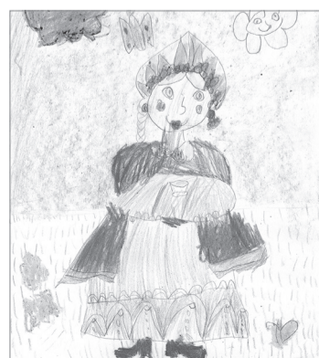
Аня Осинцева, 5 лет