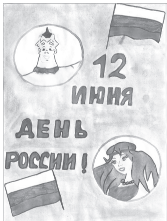
Вадим Хухоров, 5 лет