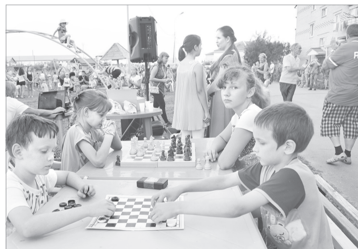
Городская детвора обожает Дни двора

Сейчас самое время пересмотреть свое отношение к окружающим, стать отзывчивее и внимательнее. А для начала может испечь пирог и угостить соседей по дому или улице?