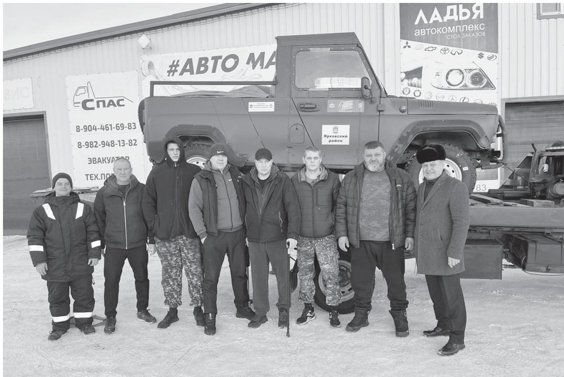
Ещё один автомобиль отправился к нашим бойцам в зону проведения СВО. Автомобиль восстановлен коллективом автосервиса «Ладья»