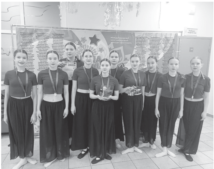
Воспитанники студии эстрадного танца «Импульс»

Подведены итоги международного фестиваля-конкурса «Главная сцена». Организатор конкурса – творческое объединение «Созвездие» (г. Москва).