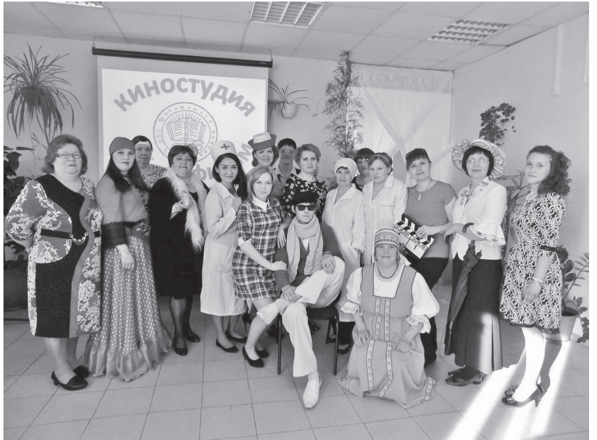
Сотрудники Центральной библиотеки

Во время карантина производится удаленное обслуживание пользователей электронной библиотеки ЛитРес. Библиотека ЛитРес – самый большой библиотечный каталог современной литературы в электронном формате. Здесь представлено более 200 000 электронных и аудиок-