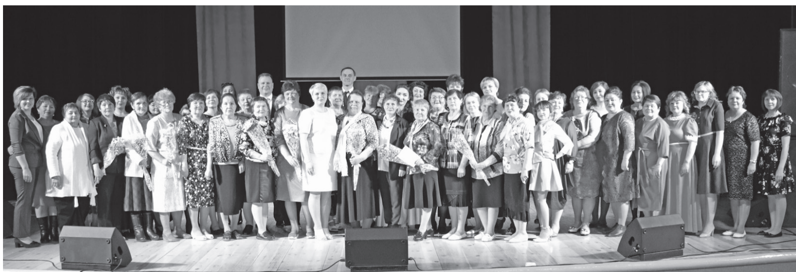
Библиотекари Вагайского района