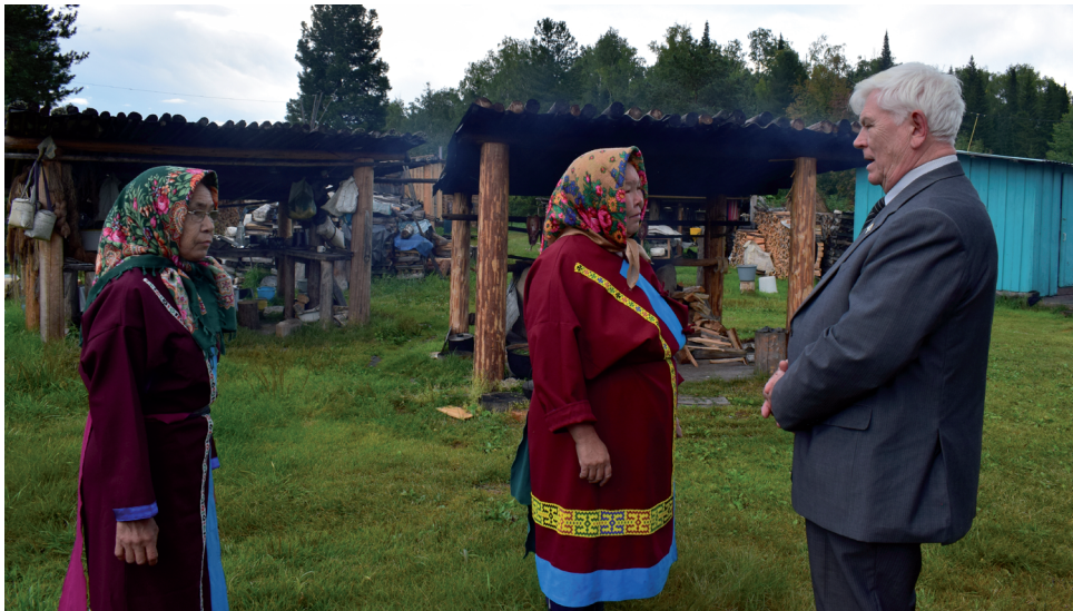
Депутат областной Думы побывал в хантыйском поселении.