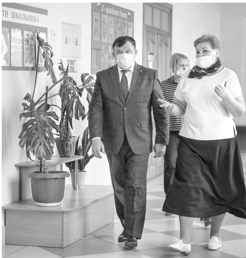
Регулярные рейды по школам и детским садам помогают выявлять имеющиеся нужды и своевременно укреплять материально-техническую базу.

– Стараемся, чтобы каждый год приносил позитивные перемены в наши образовательные учреждения. Разработана программа