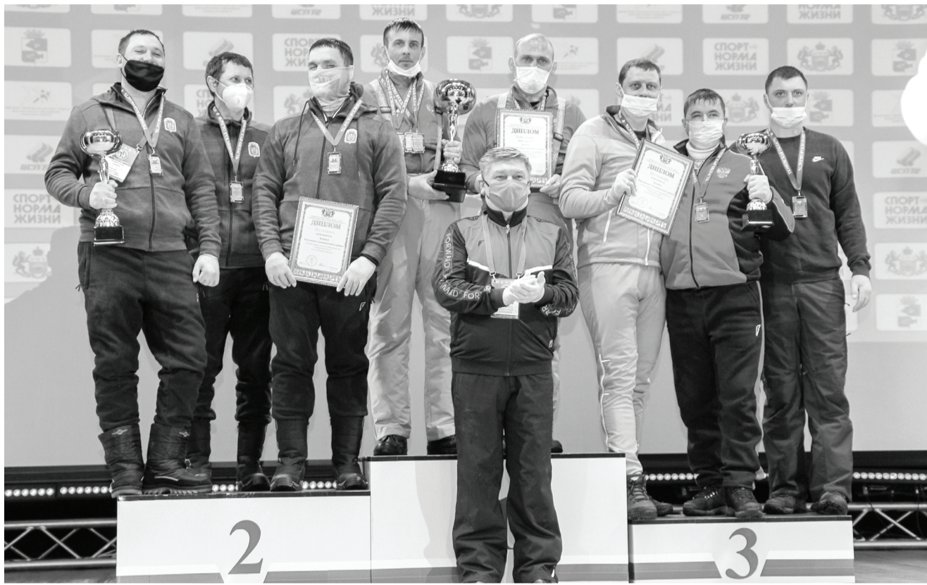
Сборная Ишимского района по охотничьему биатлону в XXVIII Зимних сельских спортивных играх Тюменской области заняла первое место.

В старших классах Лесовец участвовал в соревнованиях по волейболу, баскетболу в составе районной сборной. Потом были учёба в Ишимском многопрофильном техникуме, служба в армии. После демобилизации Рома устроился в агрохолдинг «Юбилейный», в стройцах. Участвовал в строительстве завода по глубокой переработке пшеницы «Ами-