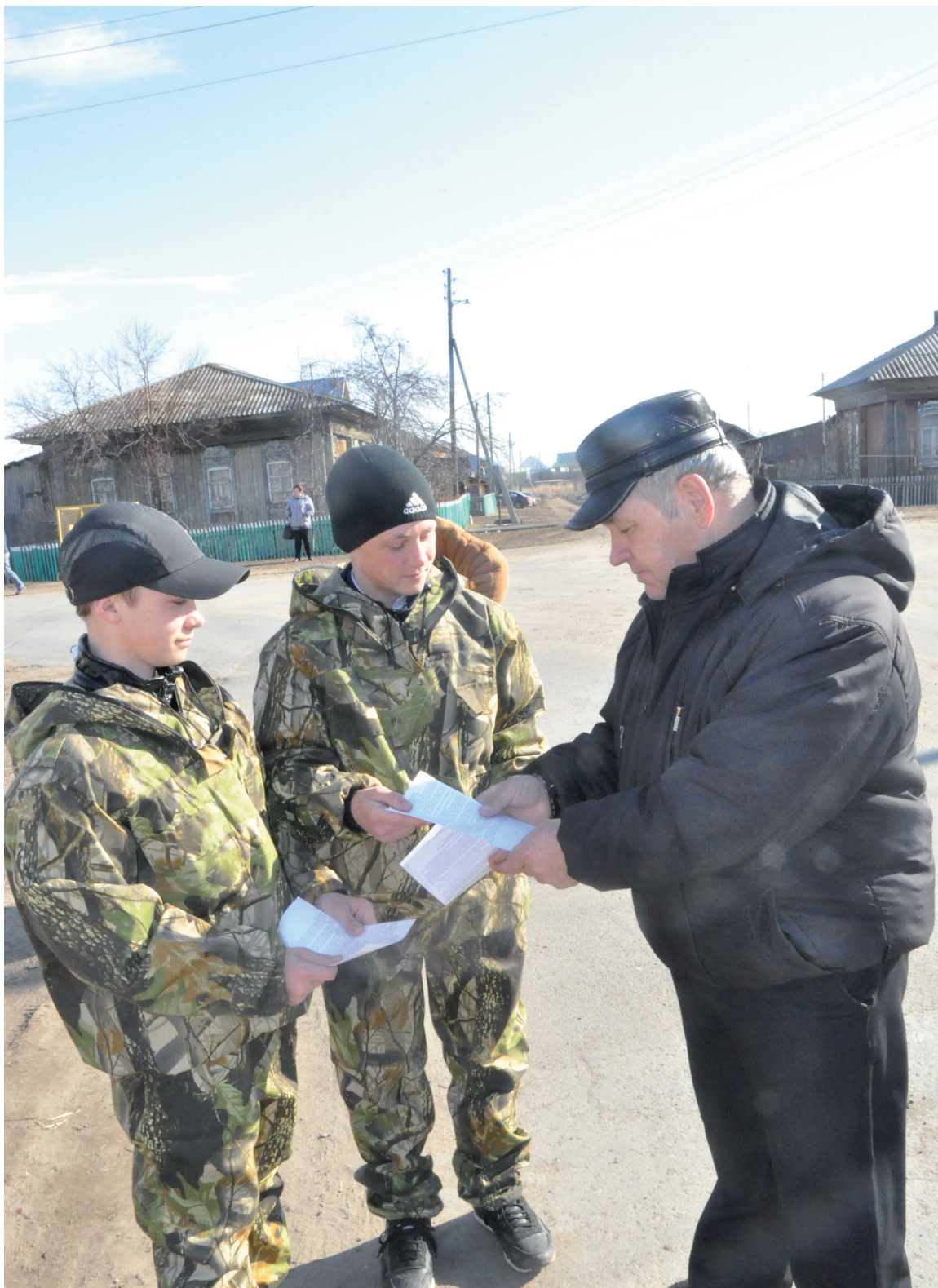
Юные солоболевские леснички раздают памятки односельчанам