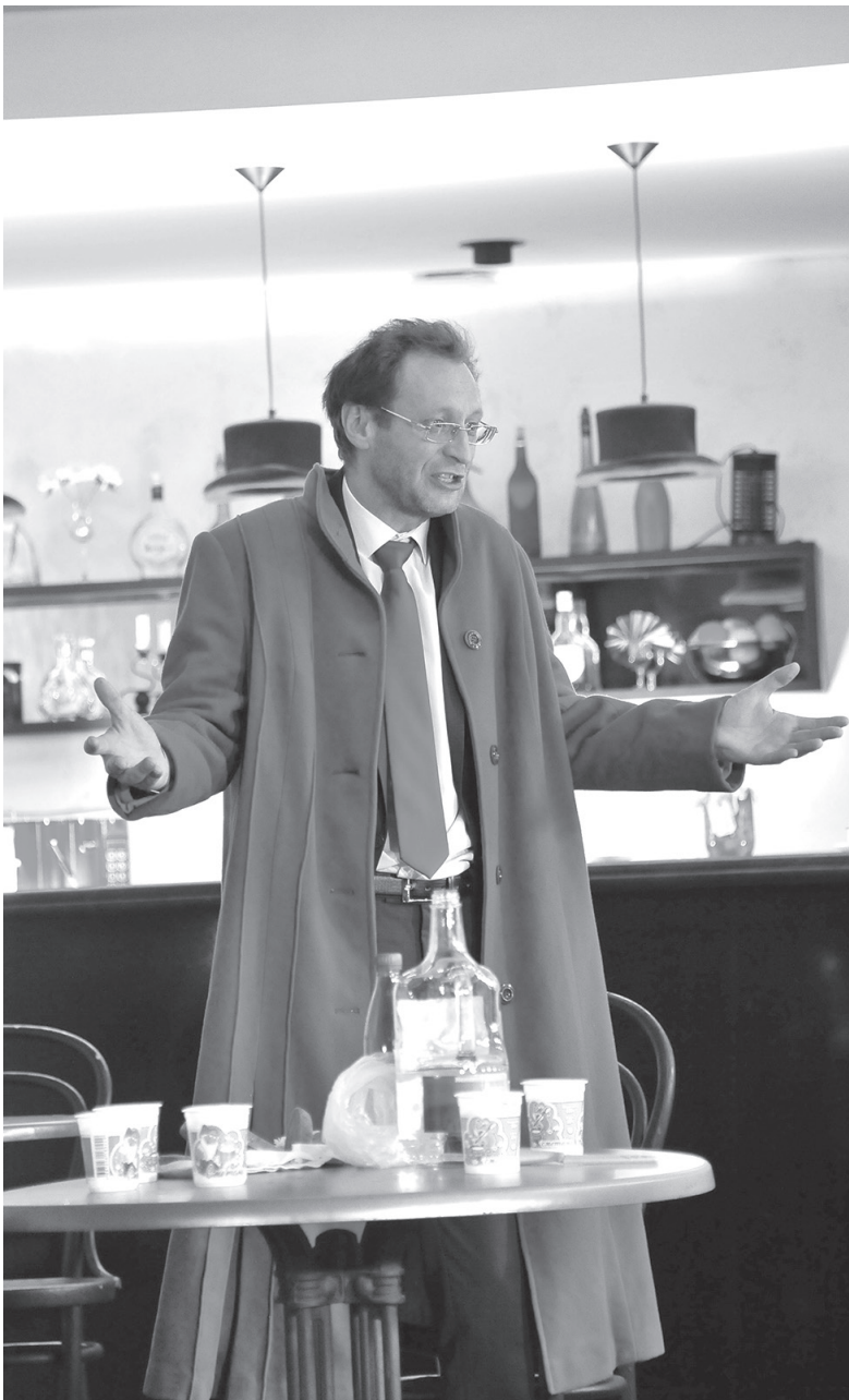
Сцена из спектакля «Тихий шорох уходящих шагов»

Навести справки и заказать билеты можно, набрав телефонный номер 27-56-30 . Вам ответят с 10.00 до 14.00 и с 16.00 до 18.00. А в понедельник не звоните — в кассе этот день выходной.