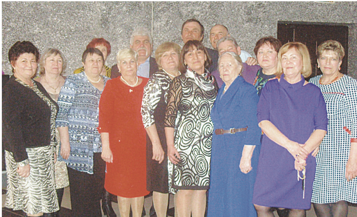
Землячество на праздновании 23 февраля и 8 марта.

Об одном из них письмо Н.Х.Файзуллиной из п. Тукман.