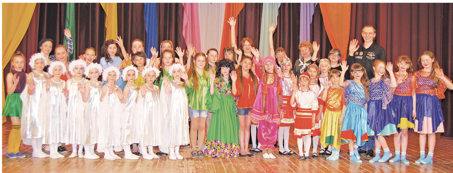
На сцене – участники младшей возрастной группы и танцевальные дуэты.

На сцене танцевальный коллектив «Монпасье» Тюневского СДК. И вот мы уже оказались на сказочной поляне среди маленьких гномов, которые своим весёлым танцем задали всем такой ритм, что усидеть на месте было просто невозможно. Эстафету перехватили девочки из ансамбля «Улыбка» (ЦДО), а здесь уже другая мелодия, напевная, расслабляющая. И опять на сцене огонь, ветер,