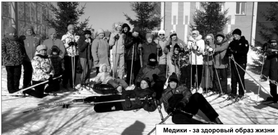
Медики - за здоровый образ жизни