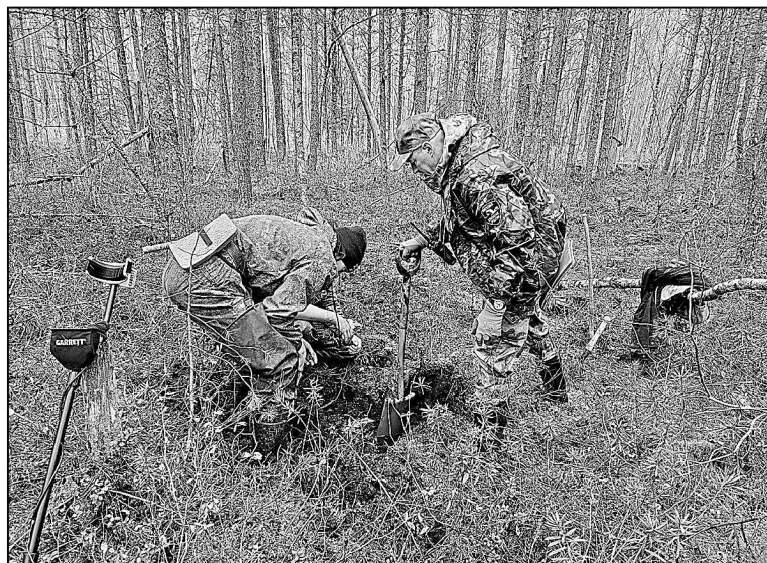
Раскопки на полях сражений — нелегкая работа. И физически, и морально.

В далеком 1942 году к северо-западу от деревни Мясной Бор, или Долины смерти — так еще называют место трагической гибели Второй ударной армии, — разворачивались события, которые до сих пор обсуждаются историками и военными экспертами. Исторические события военных лет часто разбирают с рациональной точки зрения, сравнивая число погибших, раненых и выживших, что получилось, а что нет, что повлияло на успех боя, правильно ли выбрана стра-