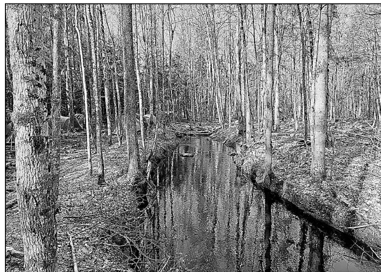
Погода была непредсказуема и изменчива.

Количество членов поискового отряда «Аэлита» растёт. Ребята из Московской школы стали активно интересоваться поисковым движением, а это значит, что все не зря. Ребята осознают значимость и важность работы по со-