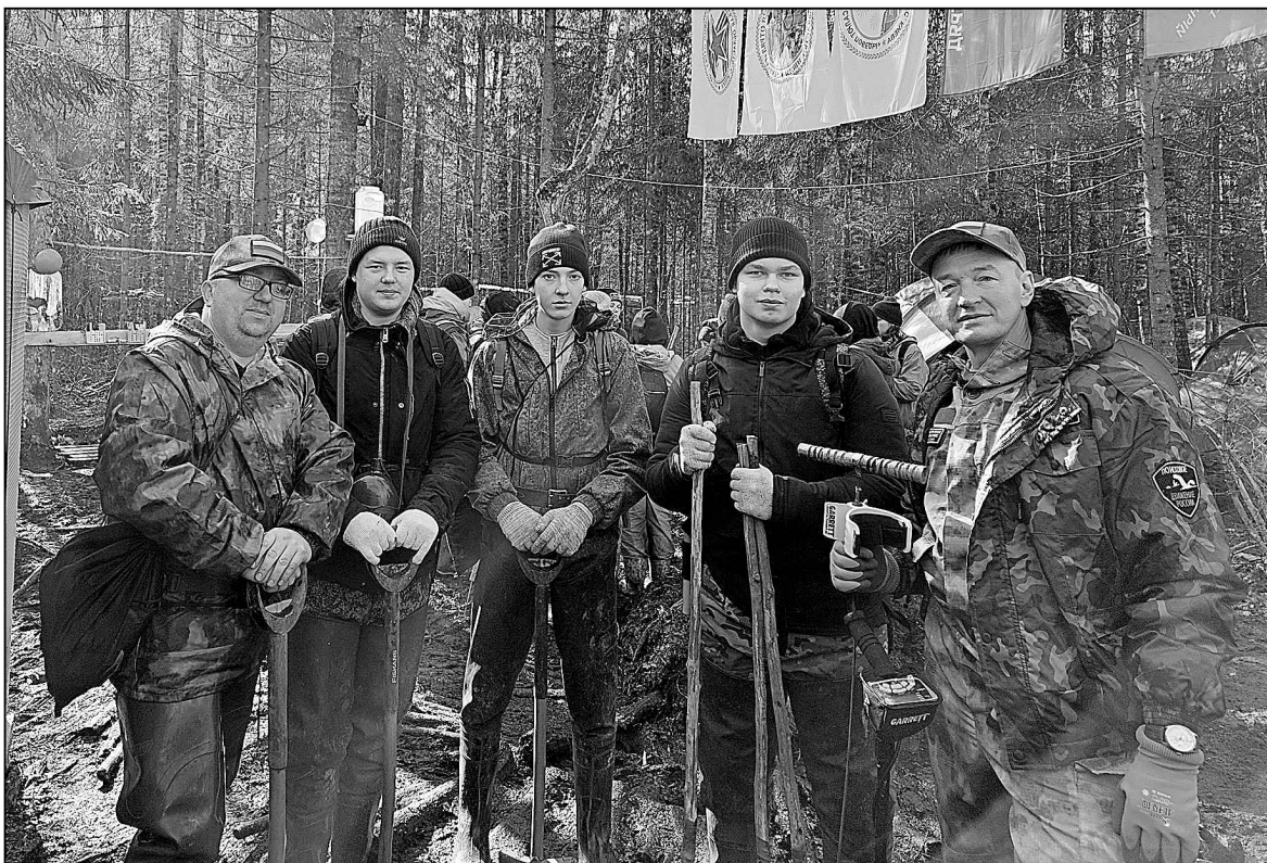
Поисковики Московской средней школы.

остановились. Выбились из сил обозные лошади. Запасы боеприпасов, снаряжения и продовольствия пришлось нести на себе.