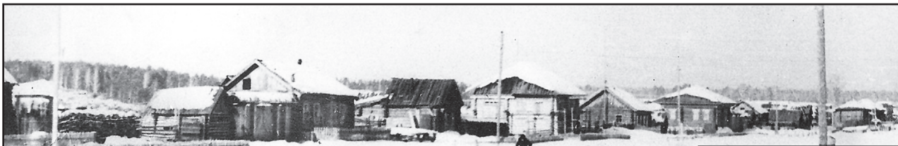
Бучинская улица 1957-1958 года