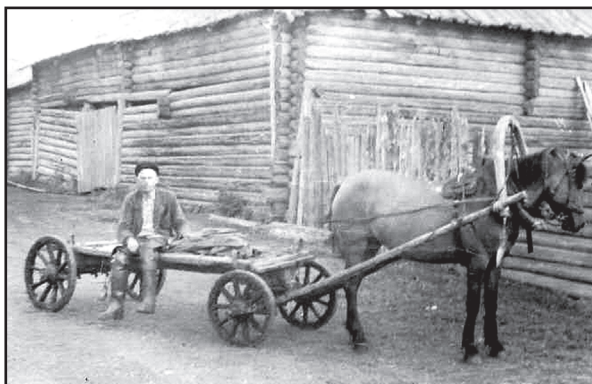
Деревня Барабан Бучинского сельсовета. Сеновал, где хранилось колхозное сено