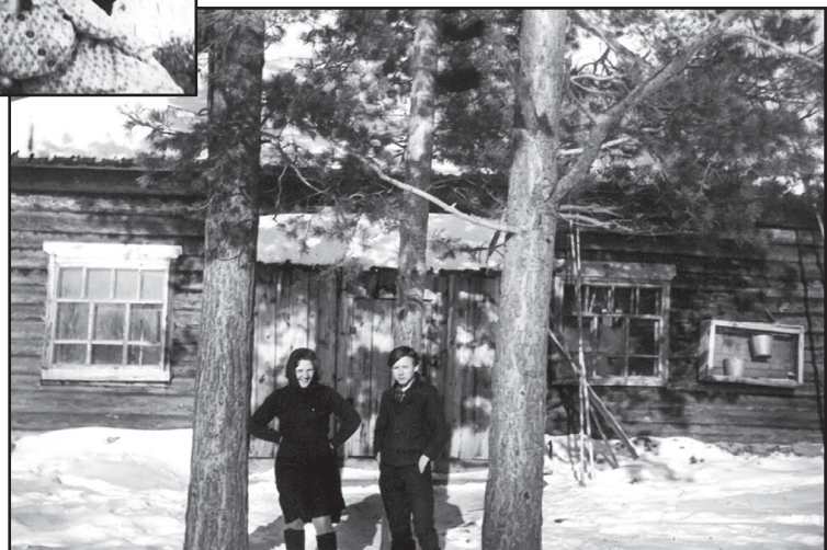
Школьная мастерская, 1967 год. Ранее здесь был молельный дом.