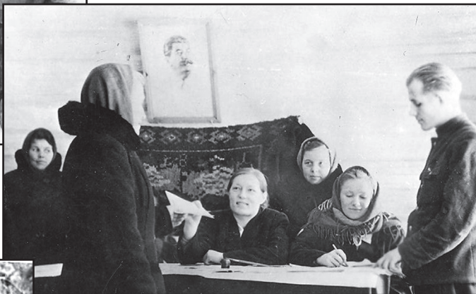
Приём в комсомол, 50-е годы