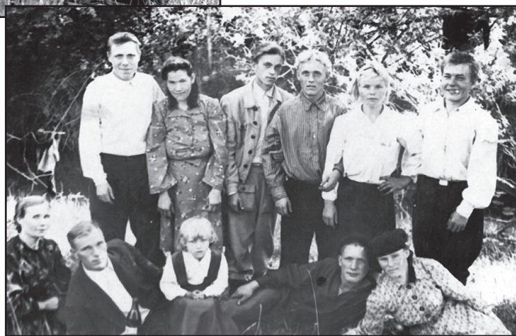
Маёвка. 1956 год