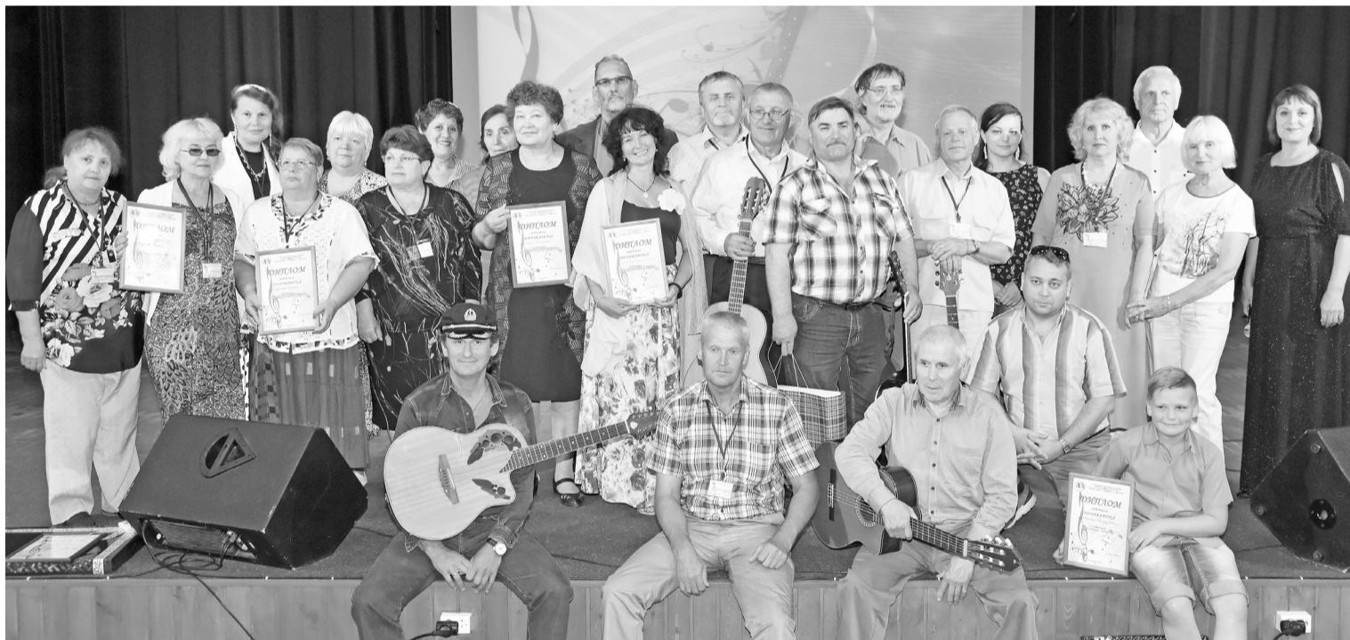
«Созвездие» талантливых людей на фестивале «Когда струна сливается со строчкой».