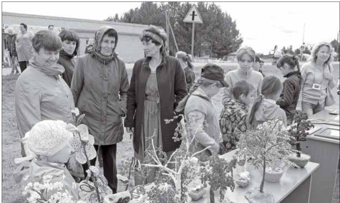
Порадовали на празднике своими шедеврами местные рукодельницы. Чего только не было: изделия из бисера, вышивка крестиком, выбитые панно и вязаные вещи

Надежда ЧЕРЕПАНОВА.