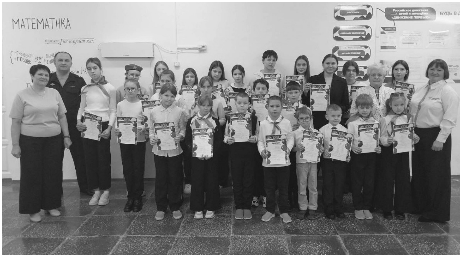
Все участники творческого конкурса отмечены грамотами

Также были и такие надписи: «Ваша служба - наш покой.