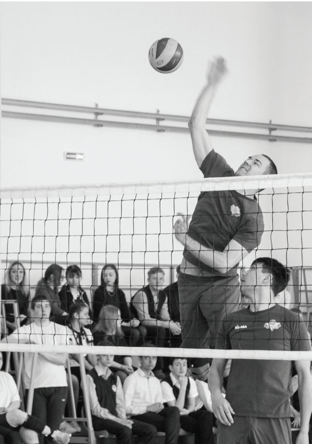
Тюменские спортсмены показали ишимским школьникам базовые элементы классического волейбола: прием, подачу, передачу, нападение, защиту, блок.

Хочется поблагодарить профессионалов волейболь-