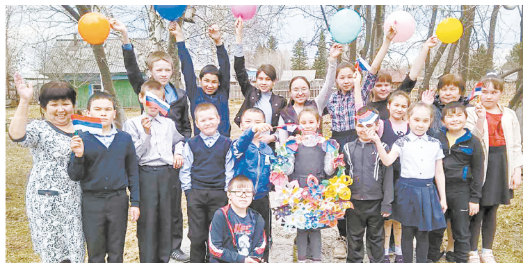
Счастливые кускургульские школьники! А ценить добро и беречь то, что им подарили, эти дети умеют.