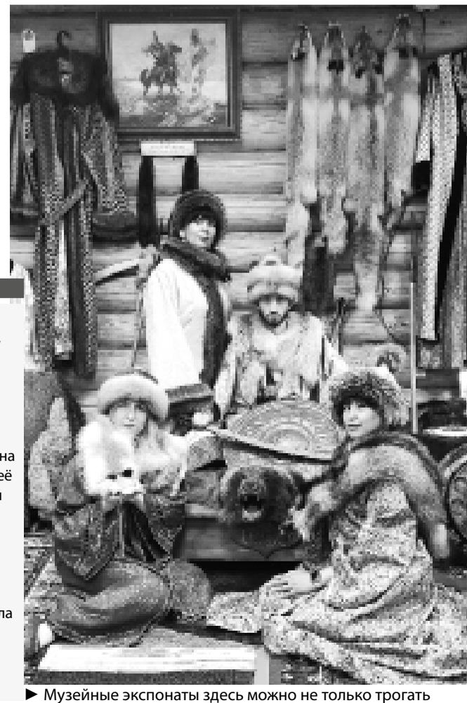
▶ Музейные экспонаты здесь можно не только трогать