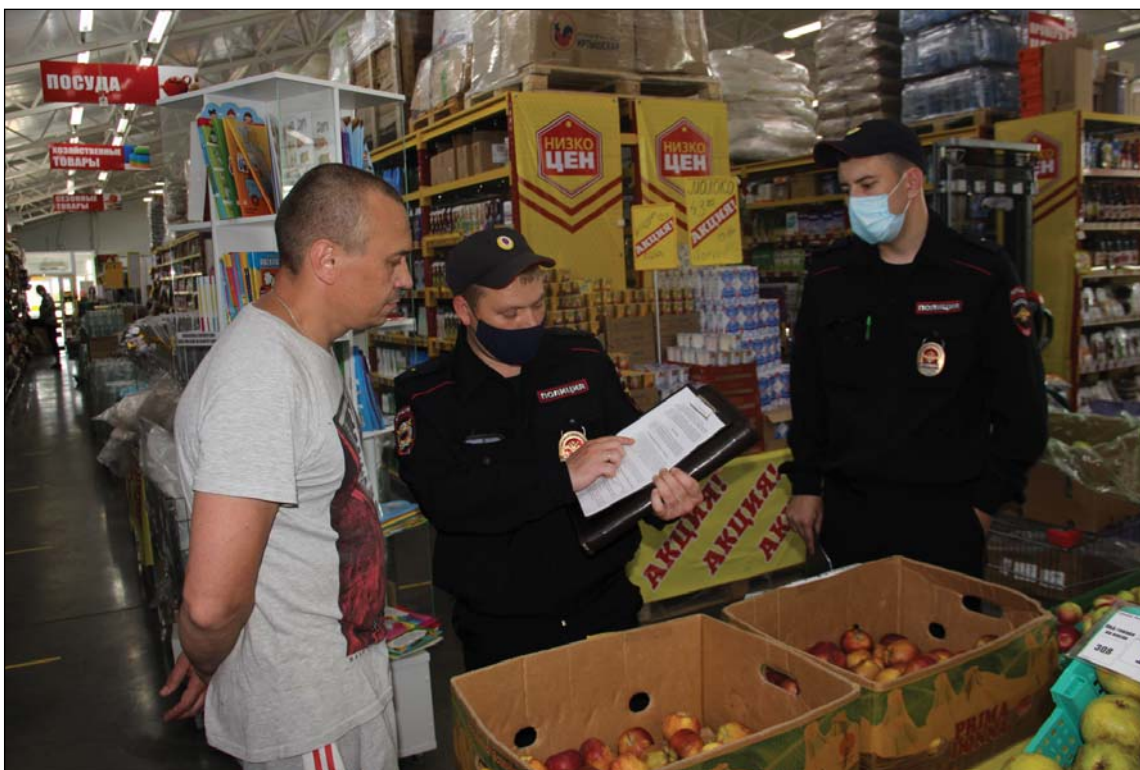
• Сотрудник полиции объясняет гражданину, какую часть закона он нарушил.

Следя за соблюдением мер, направленных на борьбу с коронавирусной инфекцией, сотрудники Аромашевского отделения полиции регулярно организуют рейды по торговым точкам, стремясь призвать граждан более ответственно относиться к своему здоровью и безопасности окружающих посредством соблюдения масочного режима. На граждан, невыполняющих правила поведения при чрезвычайной ситуации или угрозе её возникновения, сотрудники полиции в праве составить протокол. После рассмотрения которого не выполняющий постановление правительства может быть оштрафован на солидную сумму. Во время рейда подобный протокол был составлен на жителя Ямало-Немецкого автономного округа.