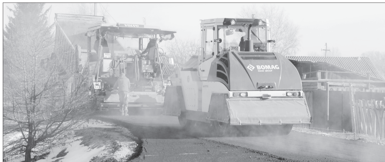
На улице Папанина асфальтируют отрезок длиной 270 метров

На ремонт дорог в Ялуторовске после паводка областное правительство выделило 12 миллионов рублей, ещё семь с половиной миллионов направили из городского бюджета.