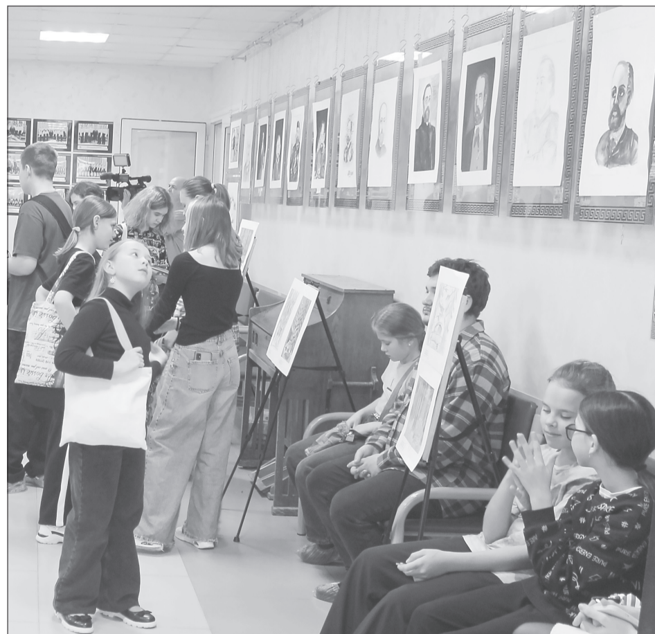
Итоговую выставку пленэрных работ представили в фойе школы искусств. Гостей привлекала и галерея портретов Саввы Мамонтова

Связанные именем. Именно в этом северном крае Савва Иванович сумел реализовать свой проект под названием «Русская Норвегия». Железная дорога с 17 станциями от Вологды до Архангельска, вопреки насмешкам скептиков, стала не только яркой достопримечательностью Русского Севера (архитектура впечатляла даже выдавших виды путешественников), но и настоящей дорогой жизни в период Первой мировой войны. Эти и другие удивительные факты расска-