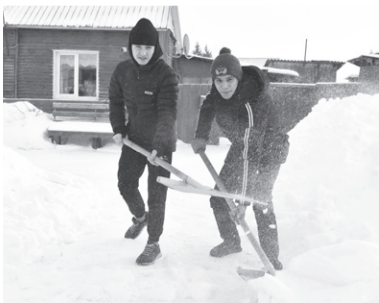
|| Сельские ребята привычны к труду.

– Сначала почистили снег, откопали из-под него дрова, хо-