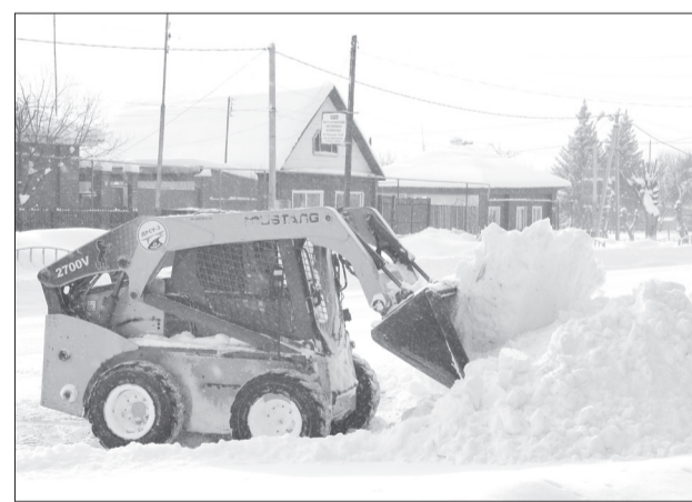
В этом году, помимо ремонтов и уборки снега, предприятие проделало огромную противопаводковую работу

следствия той авральной работы. Практически заново отстроили дорожное полотно на улицах Папанина, Холодильной, Якушкина. Я уверен, что к заморозкам дороги здесь будут гораздо лучше прежнего. К подобной экстраординарной ситуации ДРСУ оказалось готово.