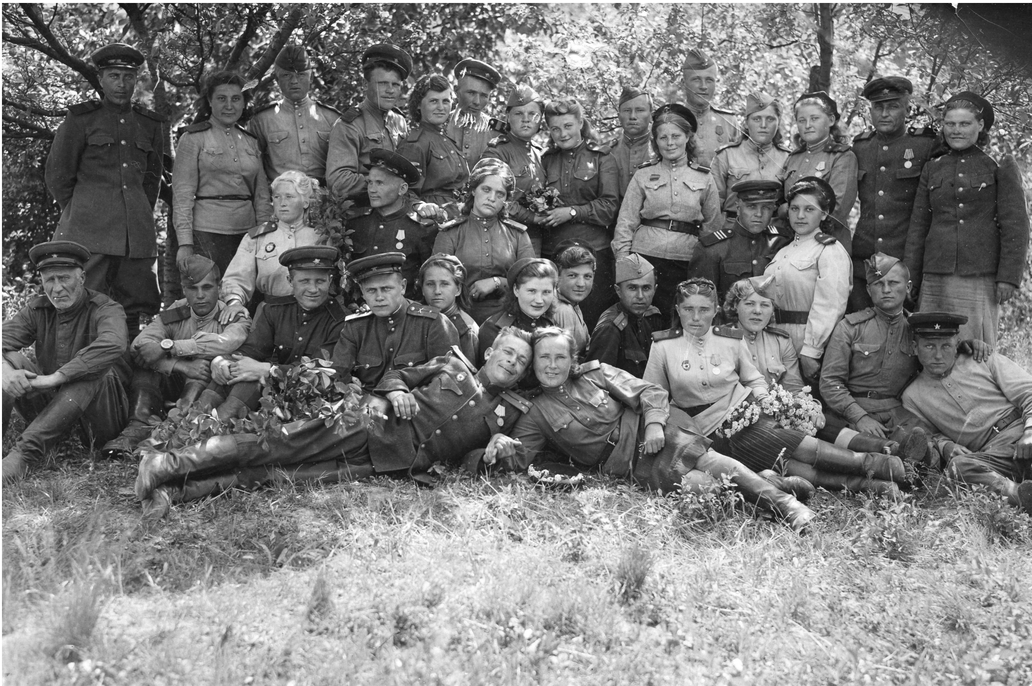
Весна 1945 года

С праздником вас, ветераны! С Днём Победы! Низкий поклон за ратный ваш подвиг!