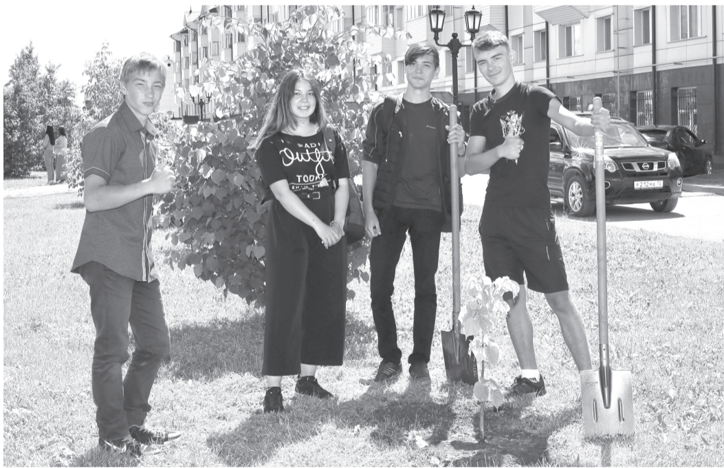
Озеленение – один из видов социально значимых работ в городе

Депутатская комиссия поддержала данную инициативу и предложила вынести вопрос на рассмотрение Тобольской городской думы.