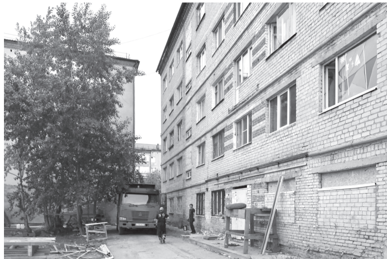
В доме 55 по ул. Октябрьской расселили 59 аварийных помещений

– По ул. Ленина, д. 138 расселено 14 аварийных жилых помещений (или 36 человек), снос этого дома осуществлён в ноябре 2019 года. По ул. Октябрьской, д.55 расселено 59 аварийных жилых помещений (107 человек), дом