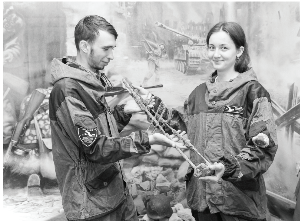
Для чего используются шина Крамера и шина Дитерихса: музей здравоохранения пополнился находками из фронтального госпиталя, которые бойцы «Санбата» привезли из поисковой экспедиции.

Для «санбатовцев» эта экспедиция стала настоящей проверкой на прочность. На