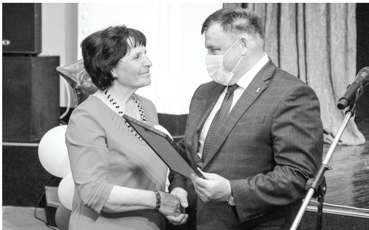
Литературное объединение «Парус» организовано в 2010 году. В него входят более 30 местных поэтов и писателей разных возрастов. Под эгидой «Паруса» увидели свет семь коллективных сборников, к изданию готовится восьмой.