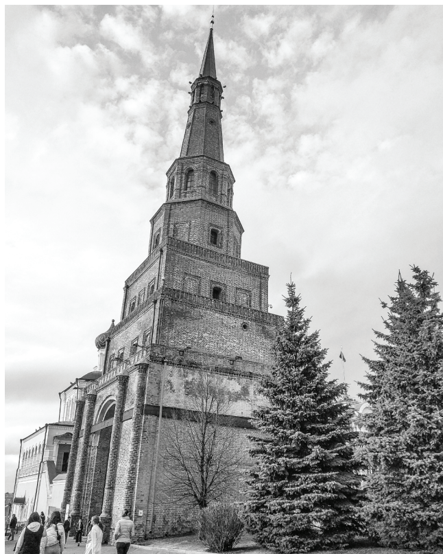
Архитектурное сооружение – башня Сююмбике – восхищает туристов и днём, и ночью, когда утопает в свете мощных прожекторов. О причинах и времени ее строительства сложены интересные легенды.

бителей бега – гости, семьи, трудовые коллективы. Всего же долгожданное беговое событие Республики Татарстан VII «Ак Барс Банк Казанский марафон» 1–2 мая собрал на шесть дистанций 14 тысяч участников из 67 регионов России и 29 стран. Статистика потом выдала, что суммарное количество преодоленных километров составило 200 тысяч.