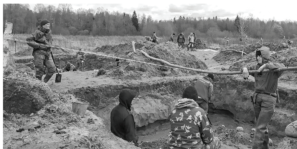
Сегодня на месте деревни Вдицко – поле с воронками, где захоронены как бойцы Красной армии, так и мирные жители.