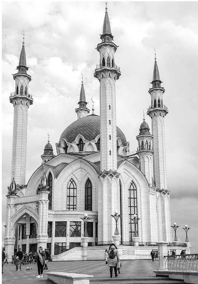
Мечеть Кул-Шариф с четырьмя высокими минаретами – красивейшее здание на территории Казанского кремля. Святилище открыло свои двери верующим в 2005 году. В стенах цитадели заложен камень в честь возрождения главной святыни татарского населения.

Дети быстро прошли регистрацию на дистанции, слоты на которые были при-