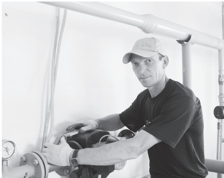
Идёт промывка и опрессовка сети в котельных

На сегодня задолженностей перед ресурсоснабжающими организациями у предприятий ЖКХ нет.