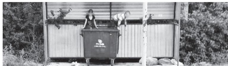
Специалисты ТЭО просят родителей рассказать детям об опасности игр на контейнерной площадке