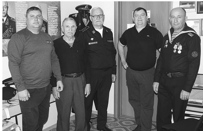
Очередной совет ветеранов флота в кают-компани

И за все прошедшие с тех пор три с лишним века Российский флот одержал немало славных побед. В наше время Военно-