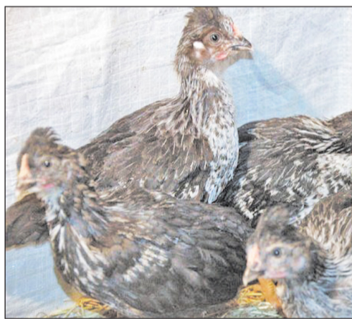
Героиня чудесного воскрешения – курочка-хохлатка. Пожелаем ей долгой счастливой жизни

Вспомнила, сколько хлопот доставил ей неожиданно появившийся выводок. Уже все уборочные работы в огороде закончились. Подошла она как-то к баку, чтобы набрать воды для уток и кур. Было это 26 сентября. Неожиданно на дорожку выкатились чёрненькие пушистые комочки с мамой-паруньей (так называют наседку, высиживающую цыплят) – красавицей ярко-красного оперения. Время для вывода цыплят было совсем не подходящее, но факт, как говорится, налицо. В каком месте выпарились цыплята, узнать так и не удалось. Просмотрели все уголки сада-огорода, но гнезда не обнаружили. Умеют куры найти укромное местечко. Делать нечего, пришлось выхаживать малышей, не выбрасывать же их. Днём выводок держали в клетке под плёнкой, на ночь в коробке заносили в дом. Так и росли они под осенними туманами и дождями, благо, нынче осень стояла тёплая и долгая. Забот, конечно, с ними было много. Вот и зима уже наступила, а цыплята ещё маленькие, едва оперились в черные полукафтанчики. Выделилась пара петушков (гребешки на головках обозначились), несколько мохноногих курочек, похожих на папашу петуха, есть пестренькая курочка ряба, как в известной детской сказке, и все без исключения с хохолками на головках. Так и жили: днём выпускали в денник, насыпанный сеном, на ночь заносили в тепло. Закалённые цыплята спокойно переносили низкие температуры. И всё было хорошо до этого дня.