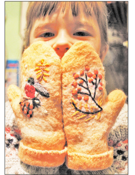
Мамы и бабушки не зря учатся новым видам творчества — вот в таких варежках потом щеголяют их родные!