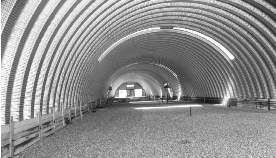
➤ Строительство нового помещения для телят

Каждое сельхозпредприятие нашего района – важная часть единого целого. Сегодня среди лидеров этого списка – ООО «Радиус-агро». Это хозяйство и сеет, и держит скот.