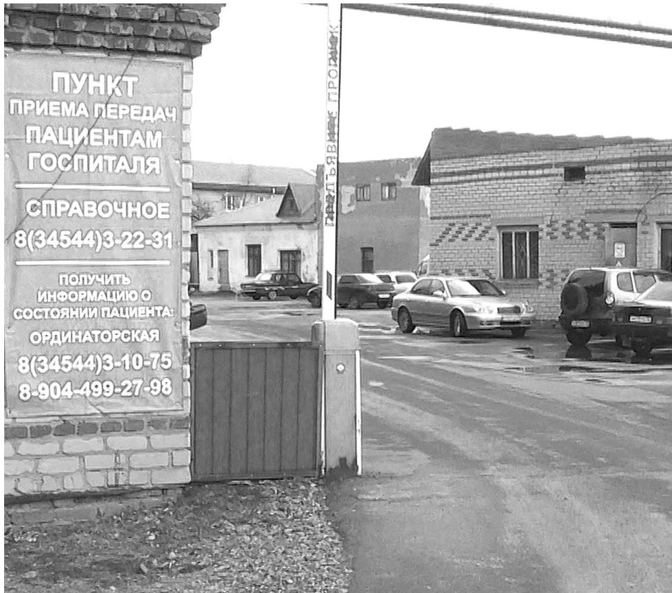
Прямо у ворот госпиталя – информационный баннер, здесь же, на проходной, можно оставить передачи для пациентов. Посторонним въезд на территорию запрещён