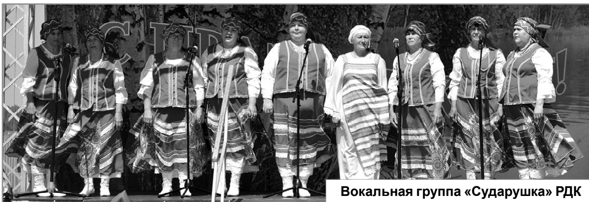
Вокальная группа «Сударушка» РДК