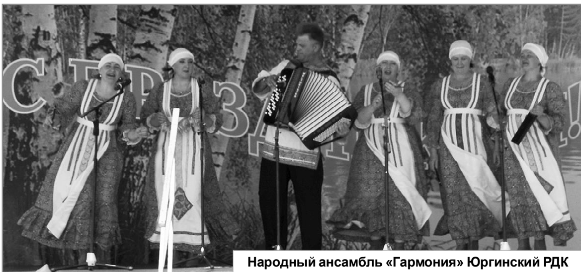
Народный ансамбль «Гармония» Юргинский РДК