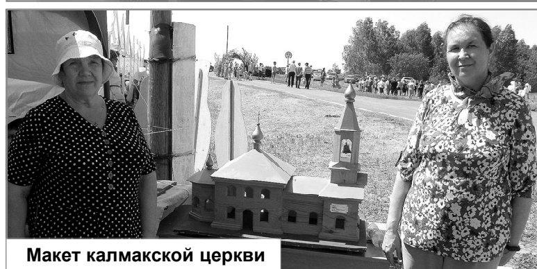
Макет калмакской церкви

тики и кружки с тематической символикой.