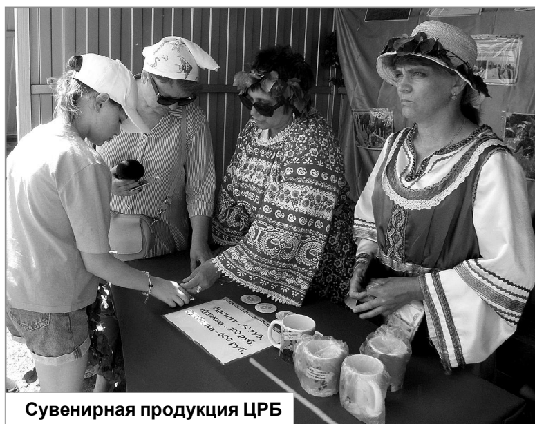
Сувенирная продукция ЦРБ

шиваем. Рядом с макетом стоят тряпичные кукольные «батюшка» и «прихожане».