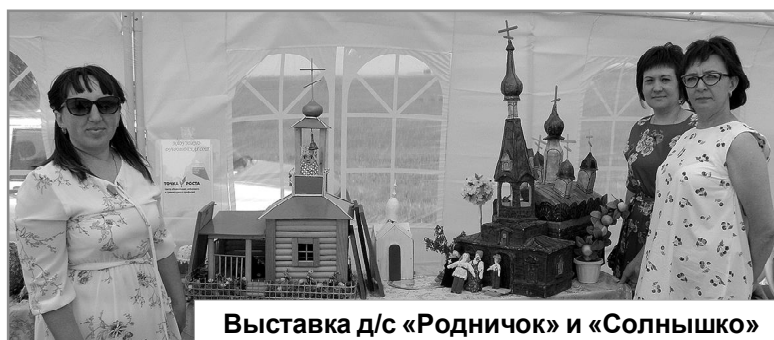
Выставка д/с «Родничок» и «Солнышко»