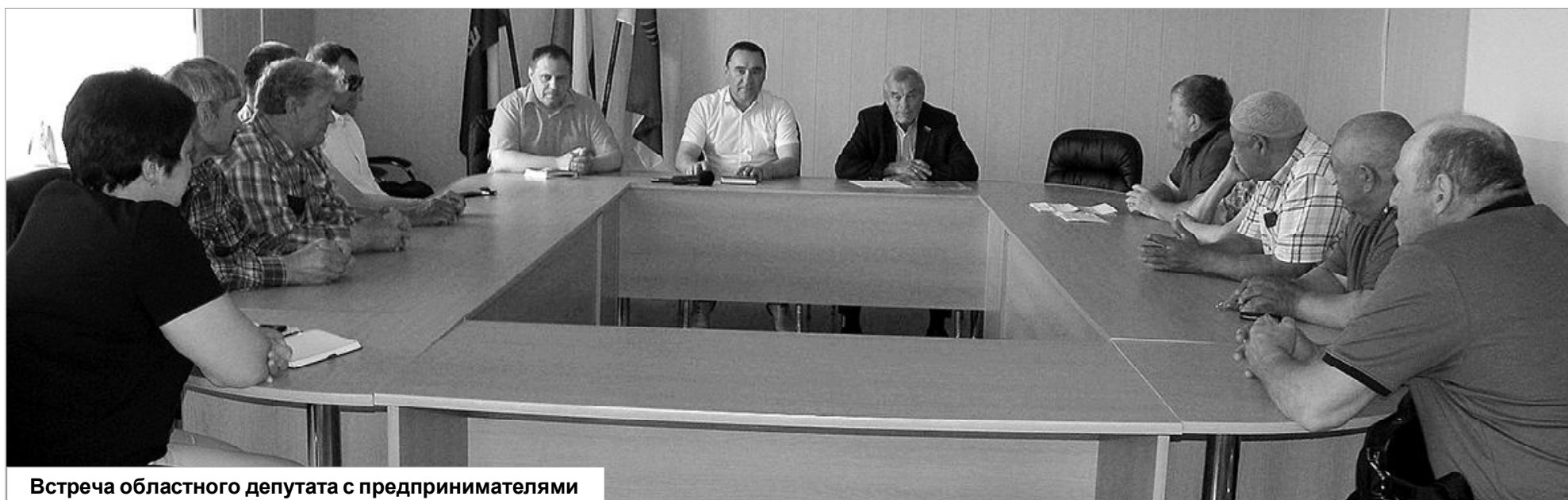
Встреча областного депутата с предпринимателями