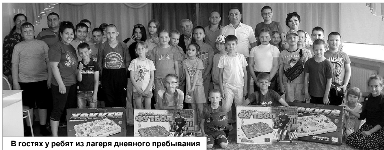
В гостях у ребят из лагеря дневного пребывания