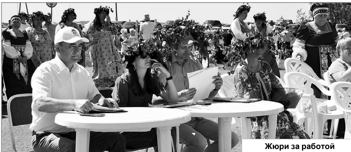
Жюри за работой