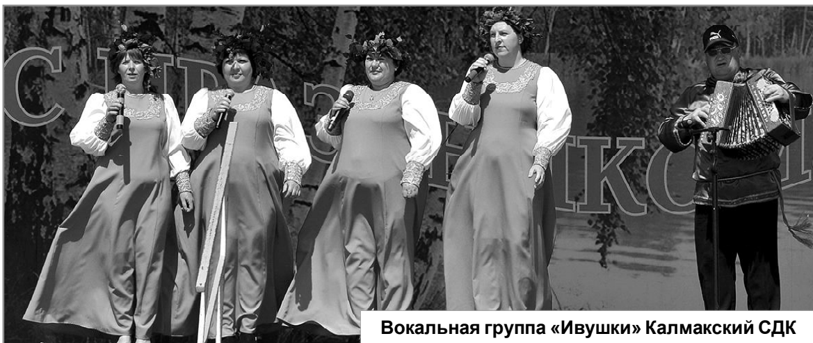
Вокальная группа «Ивушки» Калмакский СДК