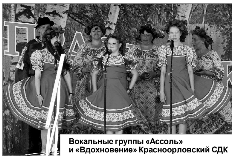
Вокальные группы «Асоль» и «Вдохновение» Красноорловский СДК