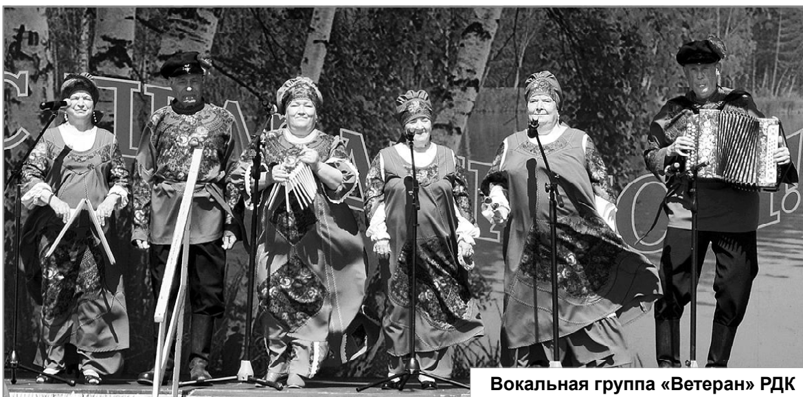
Вокальная группа «Ветеран» РДК