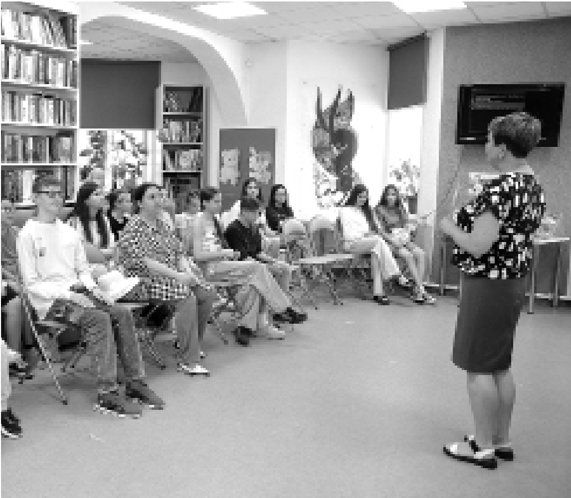
Сказочный чемпионат не оставил шанса скептикам

Тематика мероприятий разная, но все они развивающие. В июне на базе детской библиотеки стартовало несколько программ. Одна из них – сказочный чемпионат «В некотором царстве», приуроченный к международному Дню сказок. Это познавательно-развлекательное мероприятие, которые проверяют знание детей сказок (авторских, народных). Ребята принимают активное участие в различных конкурсах, преодолевают препятствия, проявляют свою смекалку, силу, показывая знание сказочного материала и учатся работать в команде. Ещё одно мероприятие «Люблю тебя, природа, в любое время года» – экологической направленности и посвящено Международному дню окружающей среды. Здесь ребята рассматривают экологические вопросы. В частности, расширяют свой кругозор в части природы – флоры, фауны, рек, озёр Тюменской области. Одна из задач любого мероприятия, проводимого в библиотеке, – заинтересовать ребят той или иной темой и рассказать им, какие книги есть в фондах, и повысить читательский интерес. Вот и сейчас дети знакомятся в процессе мероприятия с экологической ли-