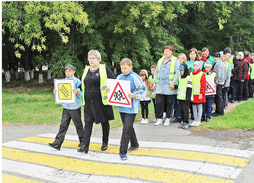
Родители вместе с детьми прошли по безопасному маршруту

В Казанском районе сотрудники ГИБДД совместно с «Родительским патрулем», представителями общественного совета и педагогами центра развития детей провели акцию «Шагающий автобус».