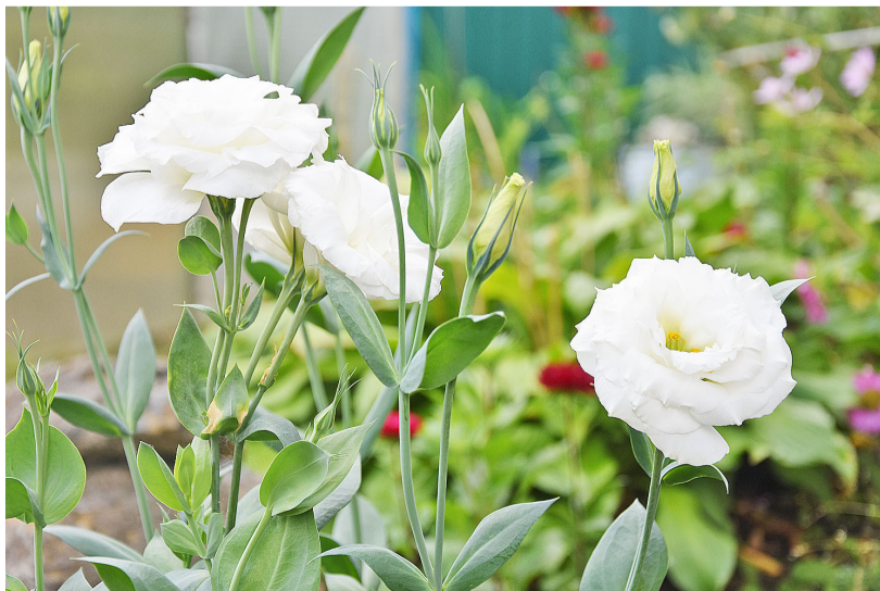
Такие нежные эустомы ещё цветут в саду Натальи Ерёмкиной