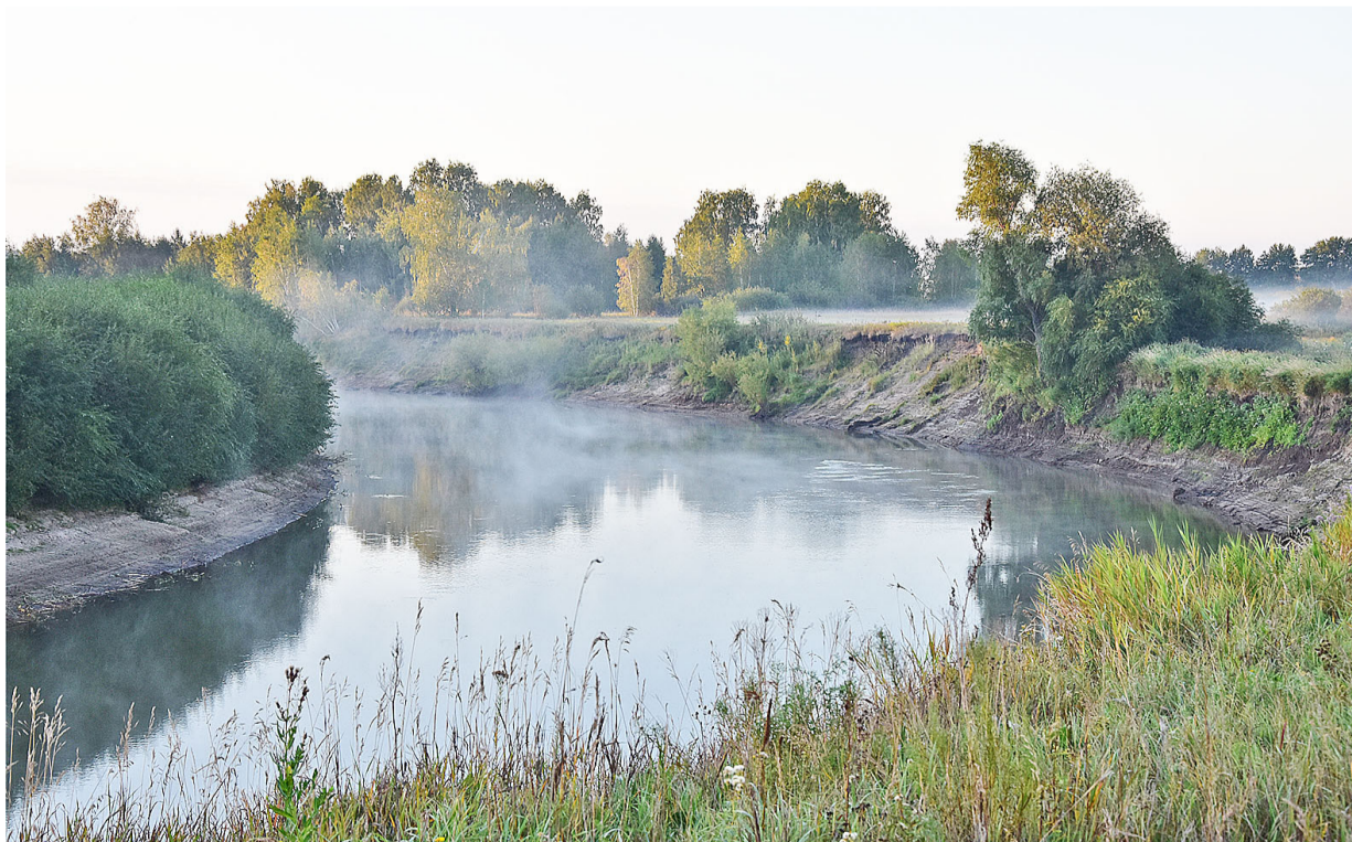
Раннее утро на реке Ишим