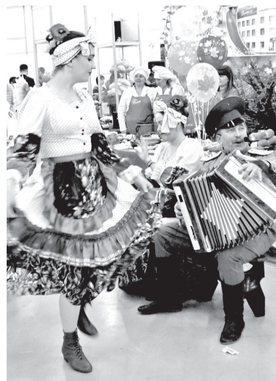
• Тобляки на выставке «Золотая осень» показали не только чем они богаты, но и как умеют веселиться в минуты отдыха.