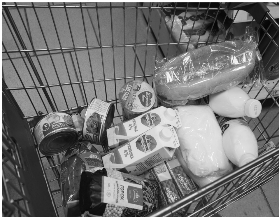
Купленные продукты и лекарства разместят на дверной ручке жилища

По заявке волонтёр перезвонит получателю услуг, представится, договорится о времени выхода по месту проживания заявителя. При встрече он предъявит паспорт, скажет о причине посещения, предложит оформить заявку. Волонтёр уточнит состав (за исключением сигарет и алкогольной продукции) и стоимость заказа. Продукты питания и товары приобретаются за счёт средств обратившихся граждан. Получатель волонтеру сумму и дату выдачи денежных средств. За покупку предъявляется чек, остаток денежных средств возвращается заявителю. В случае с гражданами, находящимися на самоизоляции, сотрудник организации либо волонтёр доставляет и передаёт покупки гражданам с