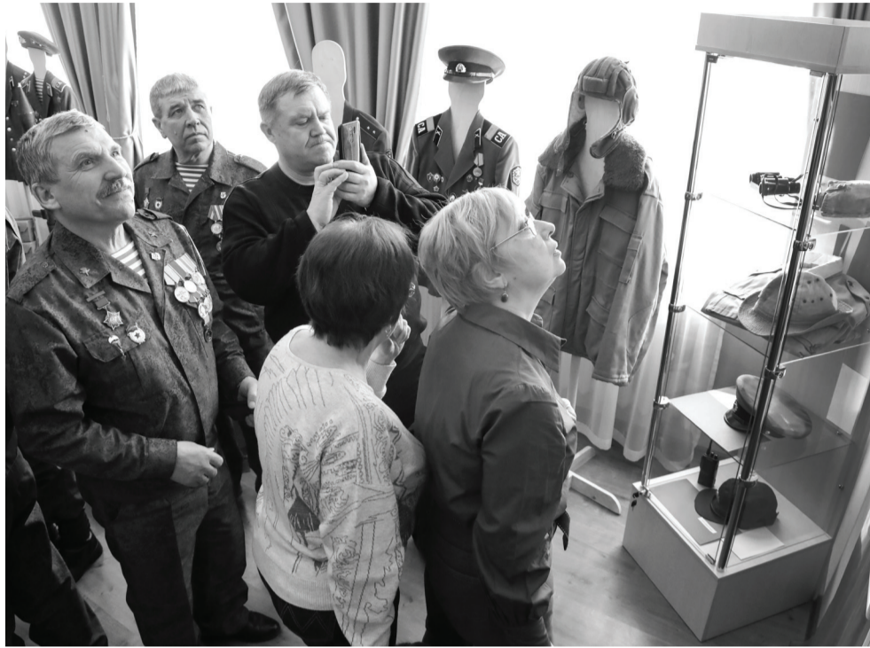
Ишимский краеведческий музей и ветераны общественной организации «Боевое братство» пополнили экспозицию выставки «От Афгана до Чечни». За минувший год появилась новая страница в истории нашей страны – специальная военная операция на Украине. Экскурсоводы ждут учащихся на Уроки мужества.

По словам Евгения Шляхты, экспонаты собирали с миру по нитке. Панама-афганка нашлась в фондах музея, китель предоставил ветеран боевых действий, хэбэшка была закуплена.