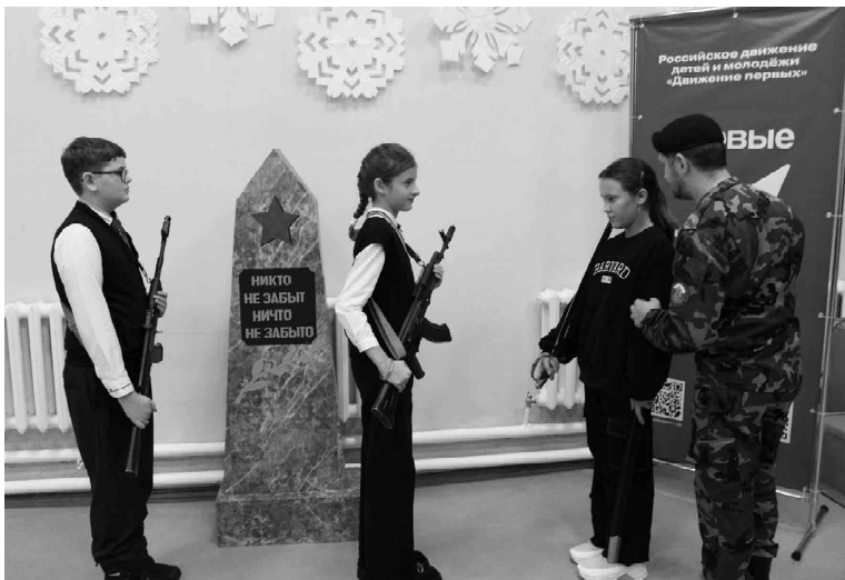
Школьники готовятся стоять в почетном карауле