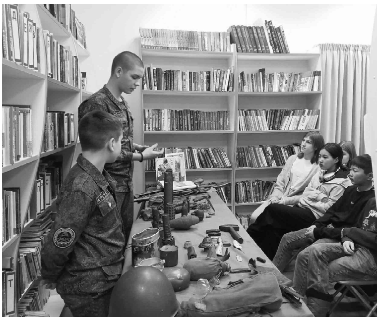
Участники военно-поискового отряда «Кречет» демонстрируют артефакты времен Великой Отечественной войны