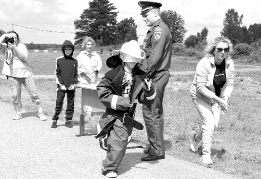
Участники в боевом облачении

Городские соревнования «Пожарные старты» среди детей оздоровительных лагерей с дневным пребыванием, проводимые в рамках реализации муниципальной программы «Развитие молодёжной политики в городе Тобольске», стали уже традиционными. Ребята их ждут с нетерпением, готовятся.