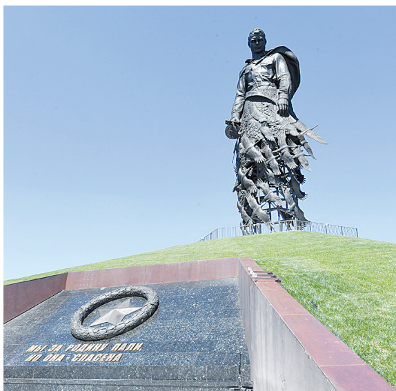
► Мемориал советскому солдату во Ржеве