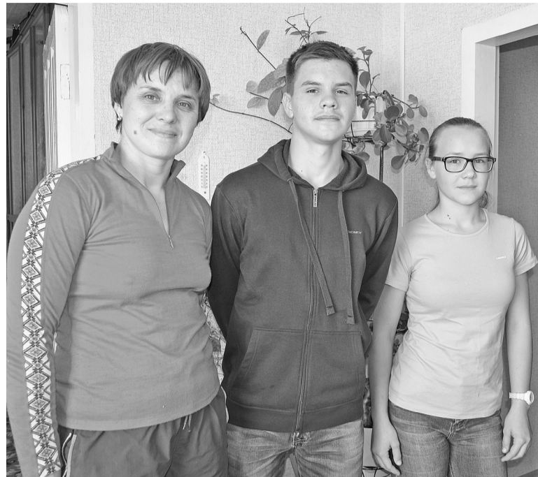
Мама, сын, дочь. Жаль, папы не хватает!